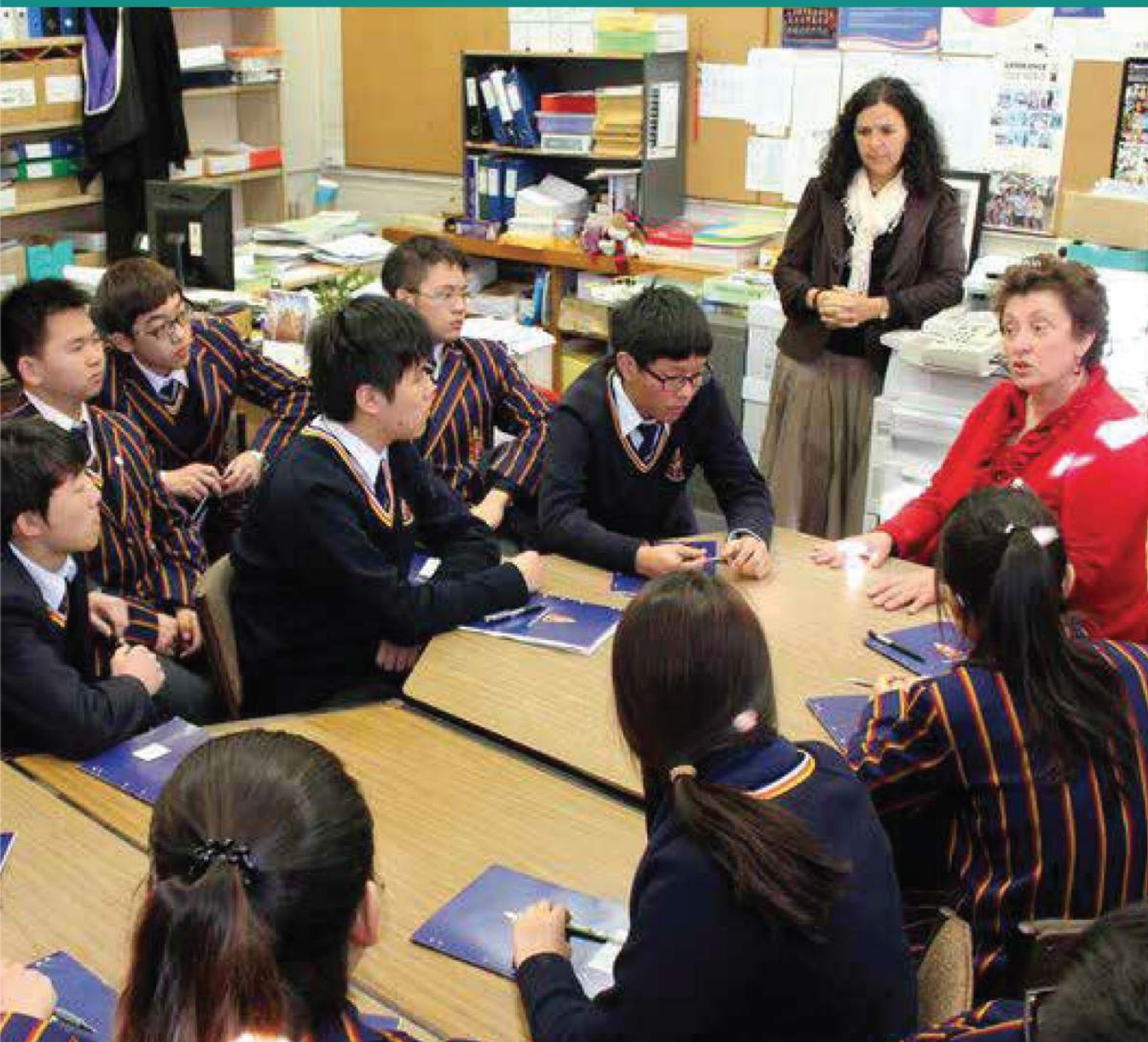
Pelajar Semenanjung datang daripada pelbagai budaya dan latar belakang